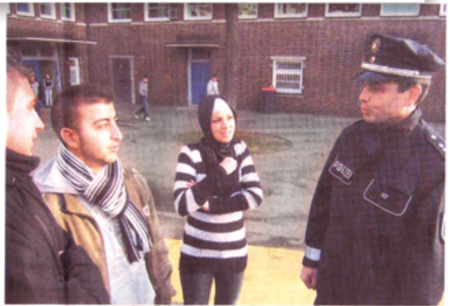
Polizeipräsenz auf dem Schulhof – hier eine Szene aus Hamburg – ist eines der Mittel, Gewalt einzudämmen.

Schreiners Plädoyer für einen offenen Umgang mit Gewalt an Schulen