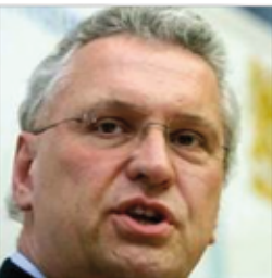
Joachim Herrmann: Ziel der Gesetzesänderung ist es, „eine beginnende Gewaltspirale von Anfang an zu stoppen“

Innenminister Herrmann fordert die rasche Ausweisung ausländischer Gewalttäter - und will einen Gesetzentwurf in den Bundesrat einbringen.